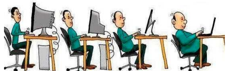
Ewolucja człowieka i komputera